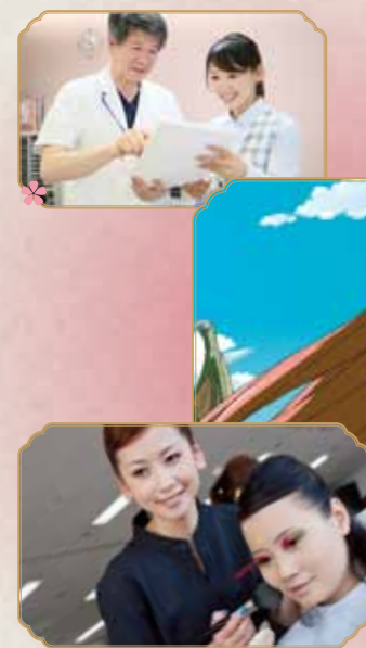
*เมื่อจบการศึกษาหลักสูตร 2 ปีขึ้นไป จะได้รับวุฒิการศึกษา "Diploma", เมื่อจบการศึกษาหลักสูตร 4 ปี จะได้รับวุฒิการศึกษา Advanced Diploma" และ