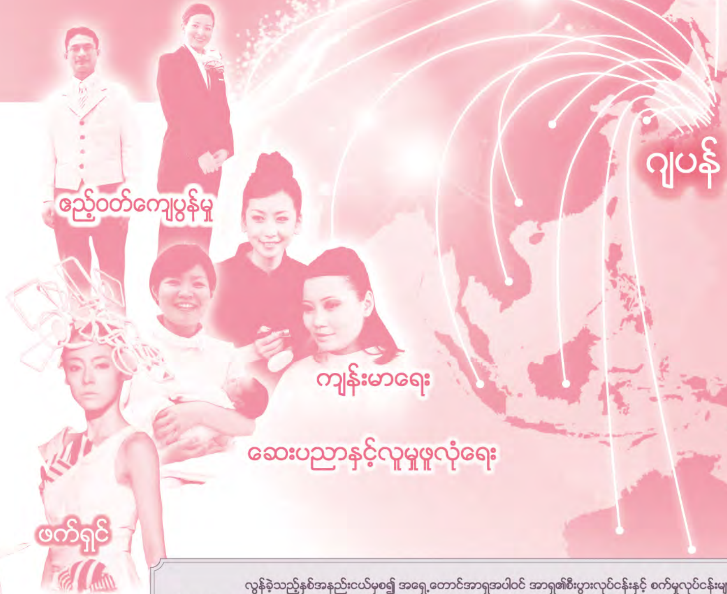
ဧည့်ဝတ်ကျေပွန်မှု

လျက်ရှိပါသည်။ ဂျပန်နိုင်ငံတွင် Professional Training College သည် လူ့အဖွဲ့အစည်းအတွက် အရေးပါအရာရောက်သော လူသားအရင်းအမြစ်များကို မွေးထုတ်ပေးနေသည့် ကျောင်းအဖြစ် အသိမှတ်ပြုခံထားရပြီး Professional Training College ကို အောင်မြင် သွားသူများသည် လုပ်ငန်းခွင်အဆင့်မြင့်ပညာရပ်များကို ကျွမ်းကျင်စွာ တတ်မြောက်ထားသူများအဖြစ် မျှော်လင့်အားထားကြပါသည်။ ထို့အပြင်၊ စီးပွားရေးအခြေအနေအပြောင်းအလဲများရှိသော်လည်း အလုပ်ကိုင် အခွင့်လမ်းနည်းများသည် ဆက်လက်မြင့်တက်လျက်ရှိပါသည်။ ထို့ကြောင့် ကမ္ဘာ တစ်ဝှမ်းတွင် နိုင်ငံခြားတိုင်းပြည်များတွင် စီးပွားရေးလုပ်ငန်းများကို လုပ်ကိုင်လျက် ရှိသော ဂျပန်ကုမ္ပဏီများသည် နိုင်ငံခြားတိုင်းပြည်များနှင့် ဂျပန်နိုင်ငံကို ပေါင်းကူး သွယ်လုပ်ဆောင်ပေးနိုင်သော လူသားအရင်းအမြစ်များကိုရှာဖွေလျက်ရှိပြီး ကျွမ်းကျင် အတတ်ပညာရပ်များနှင့် ဂျပန်နိုင်ငံ၏ ယဉ်ကျေးမှုများကို လေ့လာသင်ကြားနေသော Professional Training College နိုင်ငံခြားပညာသင်ကျောင်းသားများကို ပြင်းပြသော မျှော်မှန်းချက်များထားရှိနေကြပါသည်။ ဂျပန်နိုင်ငံ Professional Training College တွင်ပညာသင်ကြားပြီး လက်တွေ့ကျ လုပ်ငန်းခွင်အတတ်ပညာများကို တတ်ကျွမ်းတတ်မြောက်သော အတတ်ပညာရပ် အနေဖြင့်ကမ္ဘာတစ်ဝှမ်းတွင် လုပ်ကိုင်နိုင်ရန်ရည်မှန်းချက်ဖြင့် သင်ကြားပေးလေ့ရှိပါသည်။