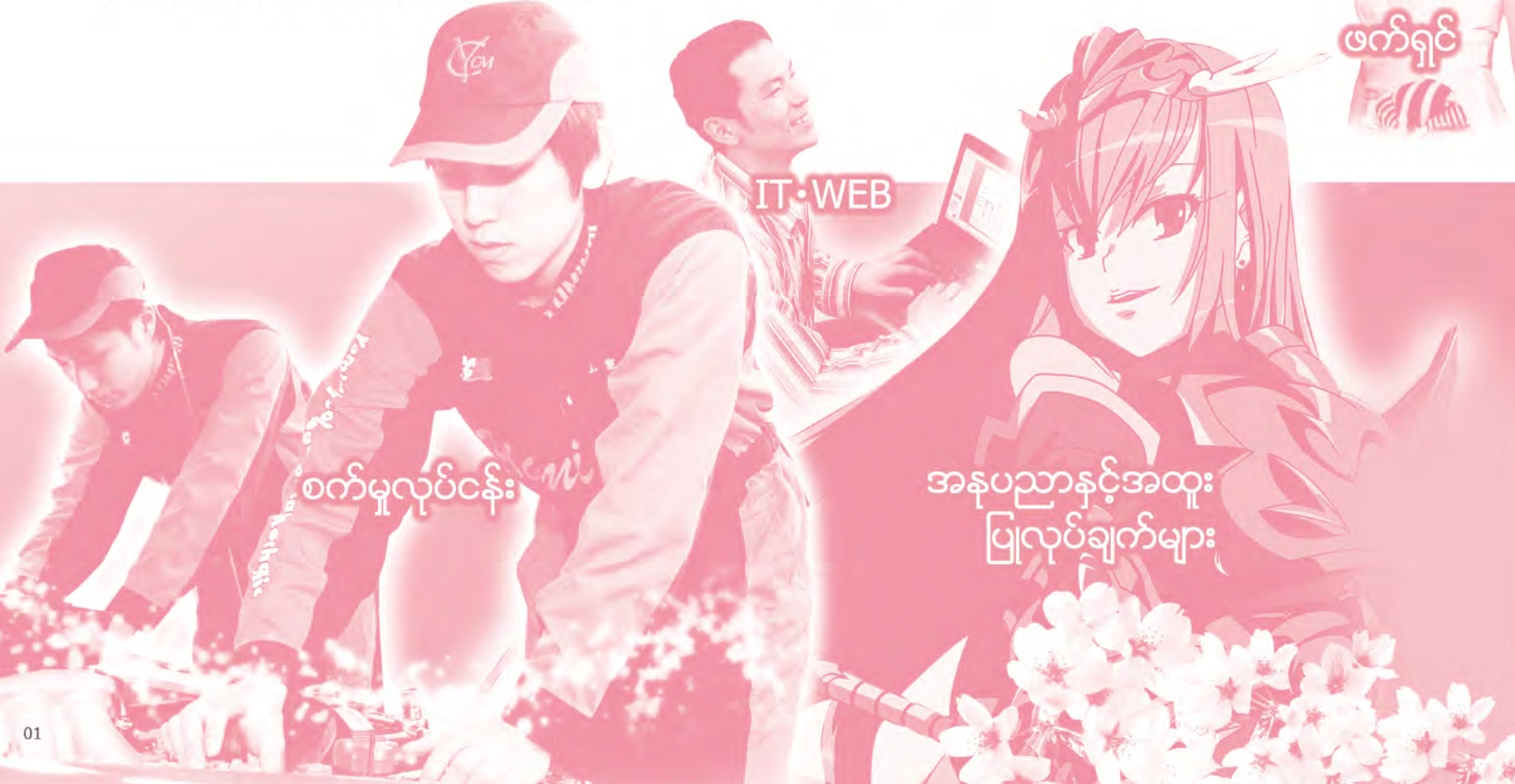
စက်မှုလုပ်ငန်း